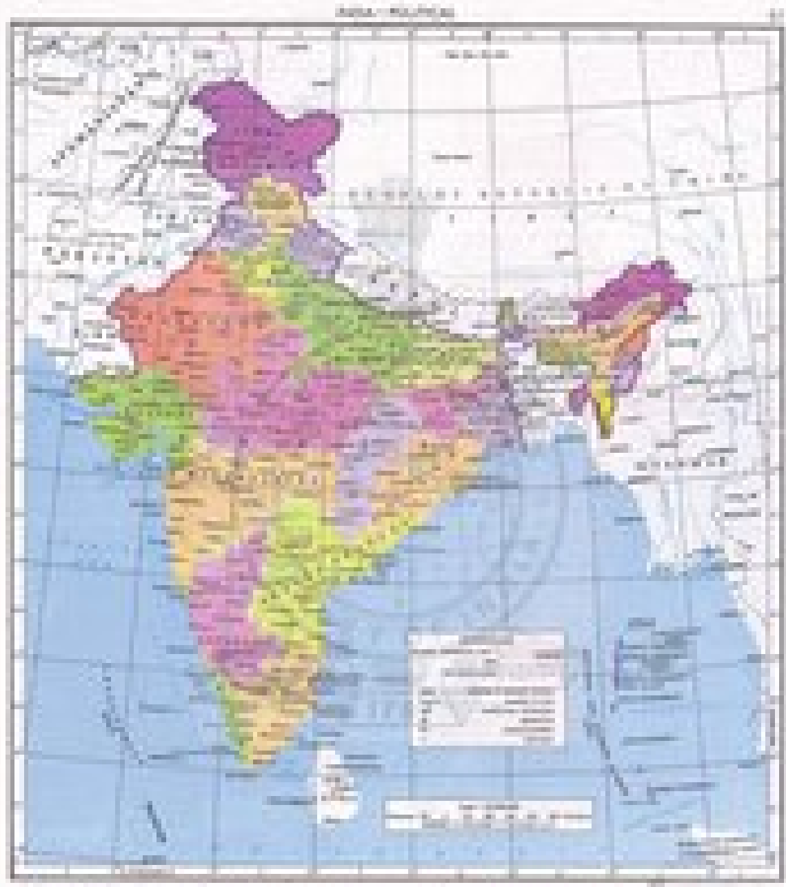
Figure 1.1: Political map of India showing states and union territories.